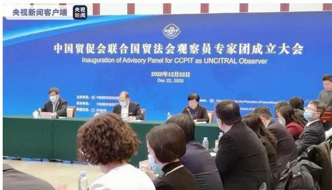
央视新闻报道画面

中国贸促会副会长卢鹏起、最高人民法院民四庭庭长王淑梅、工业和信息化部中小企业局副局长叶定达出席中国贸促会联合国贸法会观察员专家团成立大会开幕式并致辞。联合国贸法会秘书长安娜发来视频致辞。