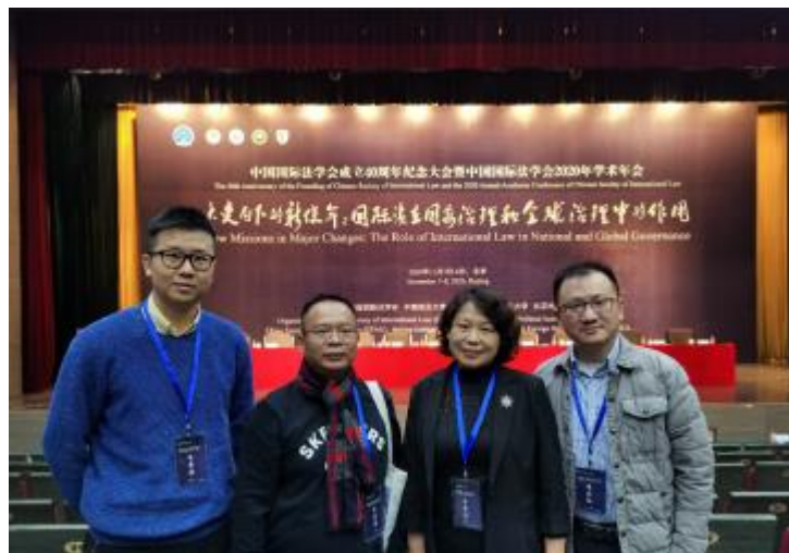
团队成员赴京参加中国国际法学会年会

中国国际法学会是在国家民政部登记的全国性学术团体，成立于 1980 年 2 月，由外交部主管。中国国际法学会会员来自全国的国际法教学研究机构和相关国家机关及实务部门。40 年内，学会为建设社会主义法治国家、实现中华民族伟大复兴、推进全球治理与国际法治做出了重要贡献。